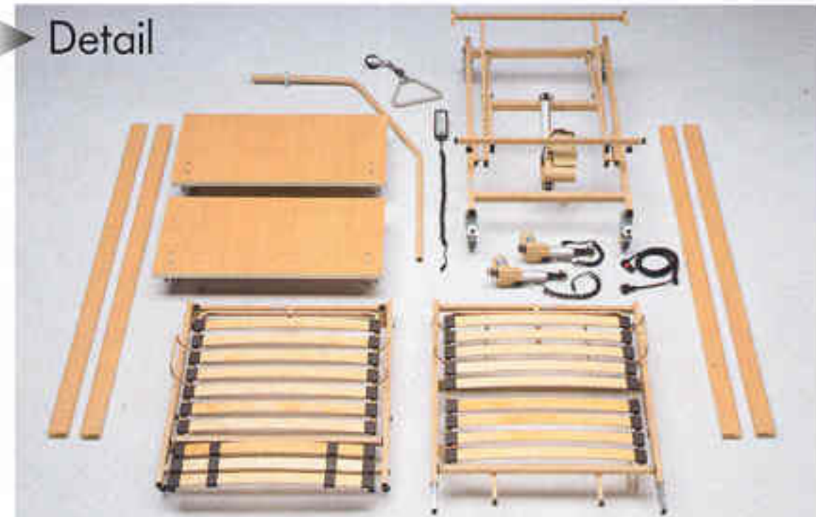
Pflegebett in Komponenten zerlegt