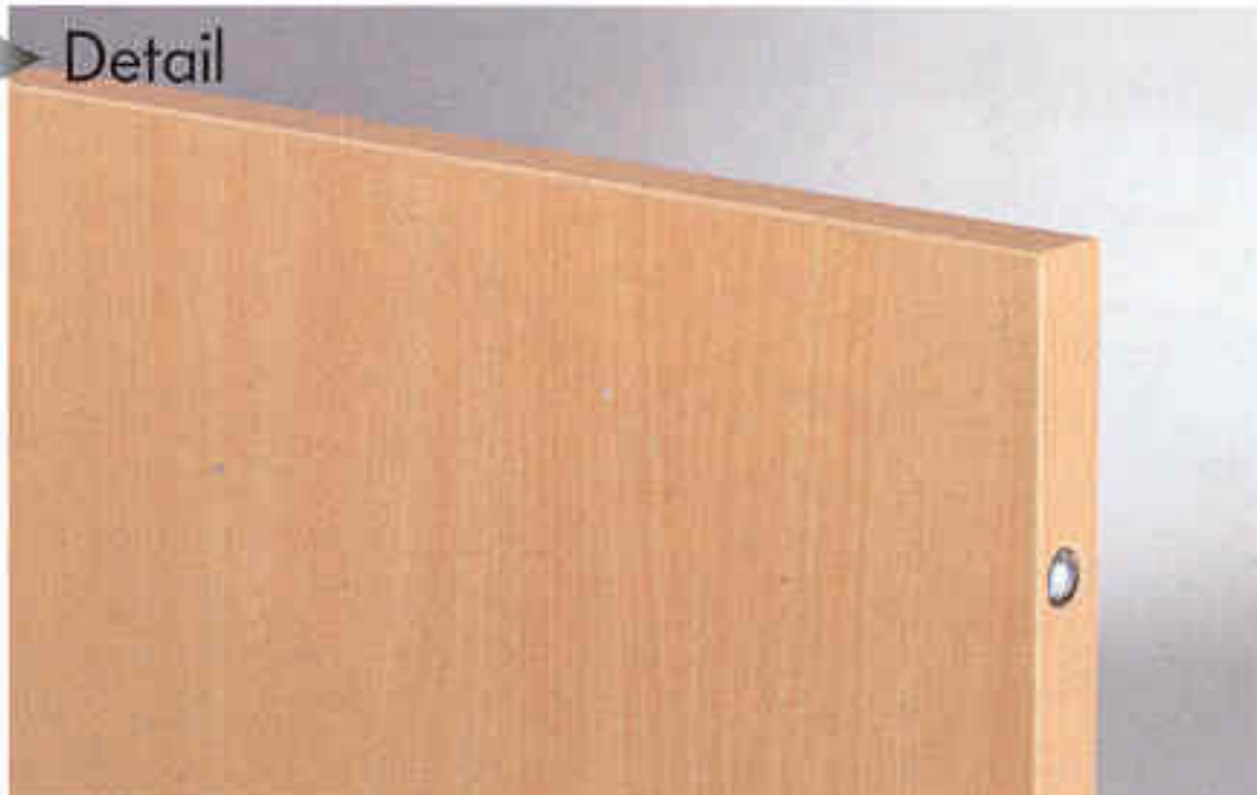
Kopfbrett ohne seitliche Rundstollen (mit Kunststoffumleimern)