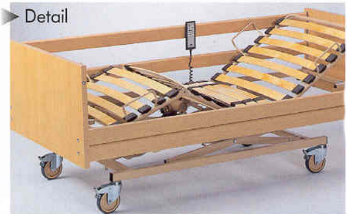
Unterschenkellehne manuell absenkbar