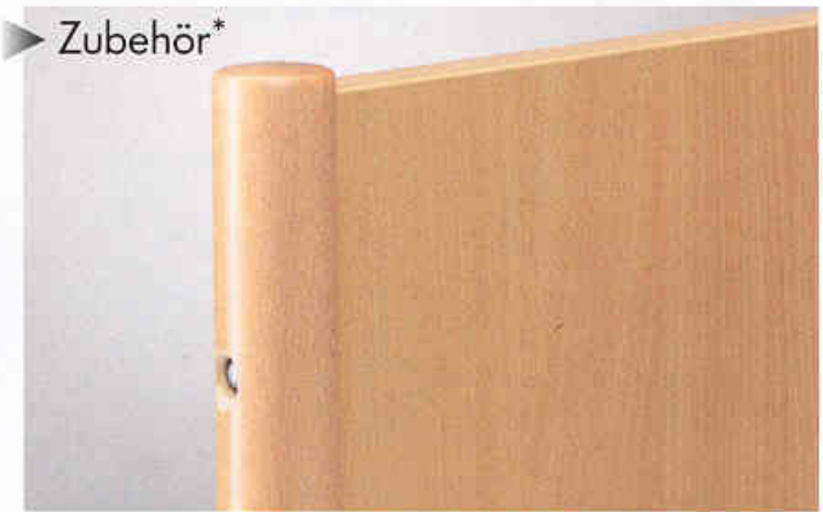
Kopfbrett mit seitlichen Rundstollen