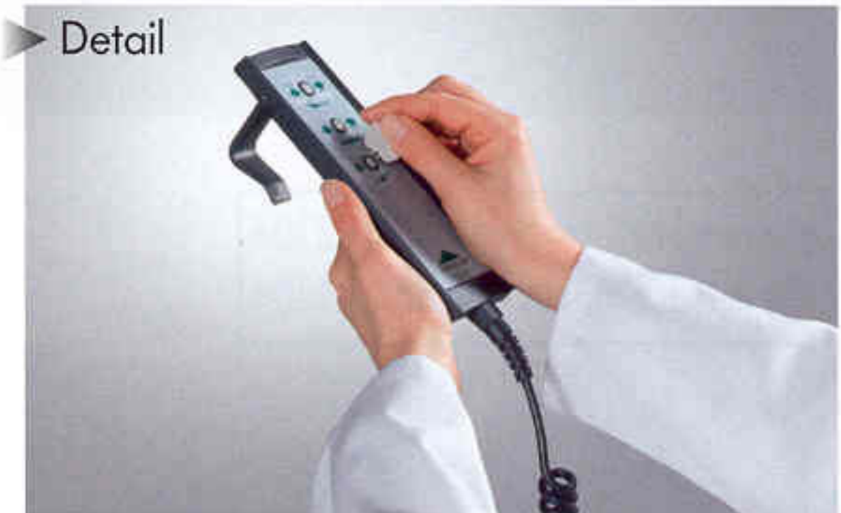
Handschalter mit selektiver Sperrfunktion