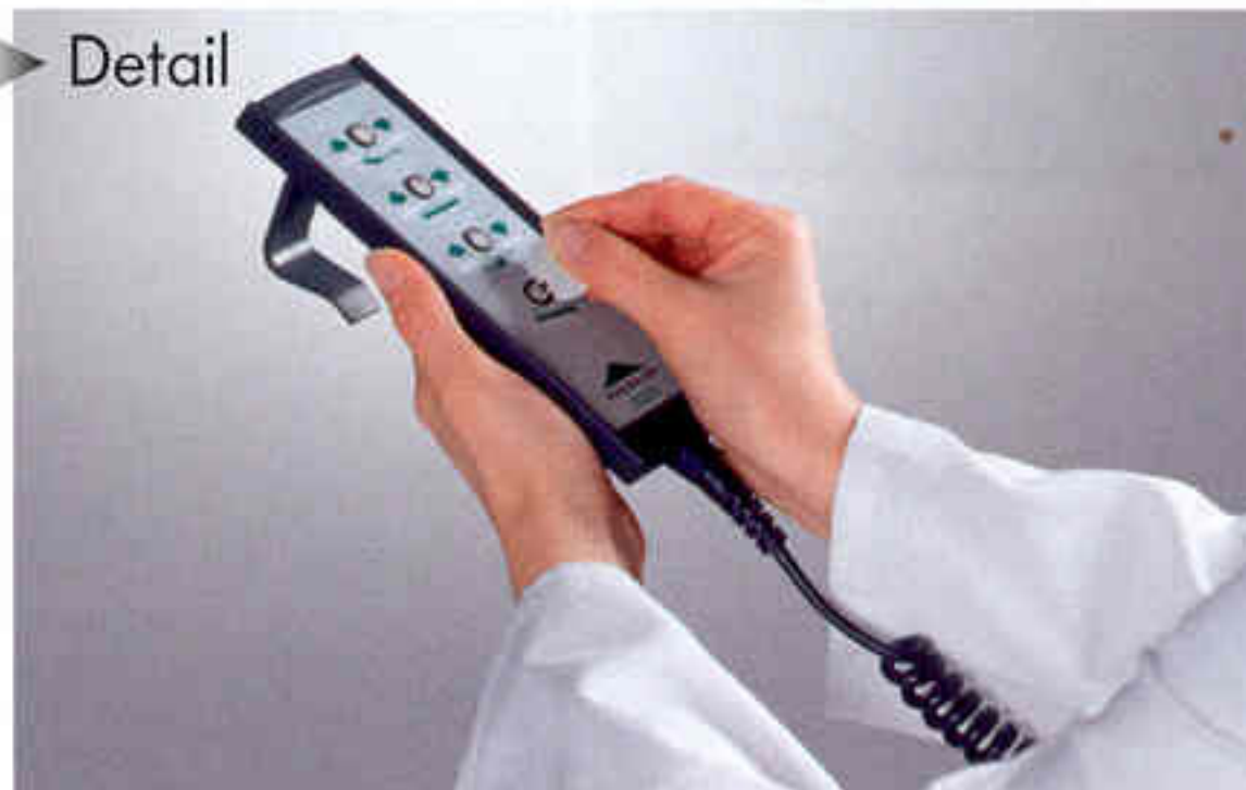
Handschalter mit selektiver Sperrfunktion