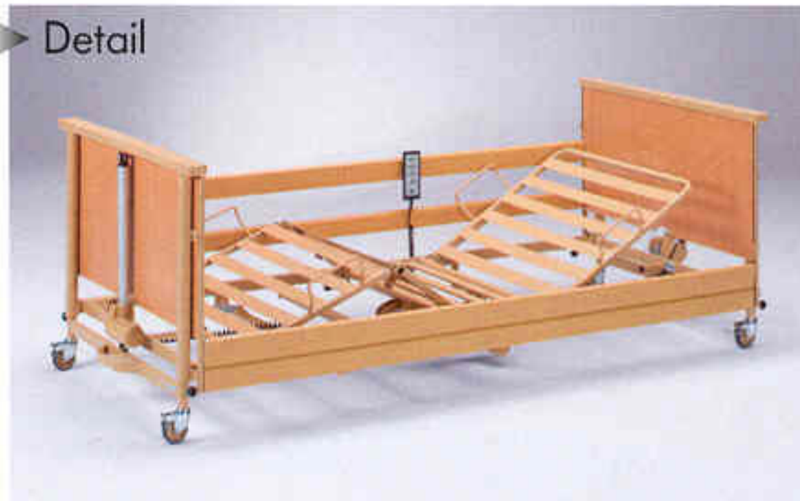
Unterschenkellehne manuell absenkbar