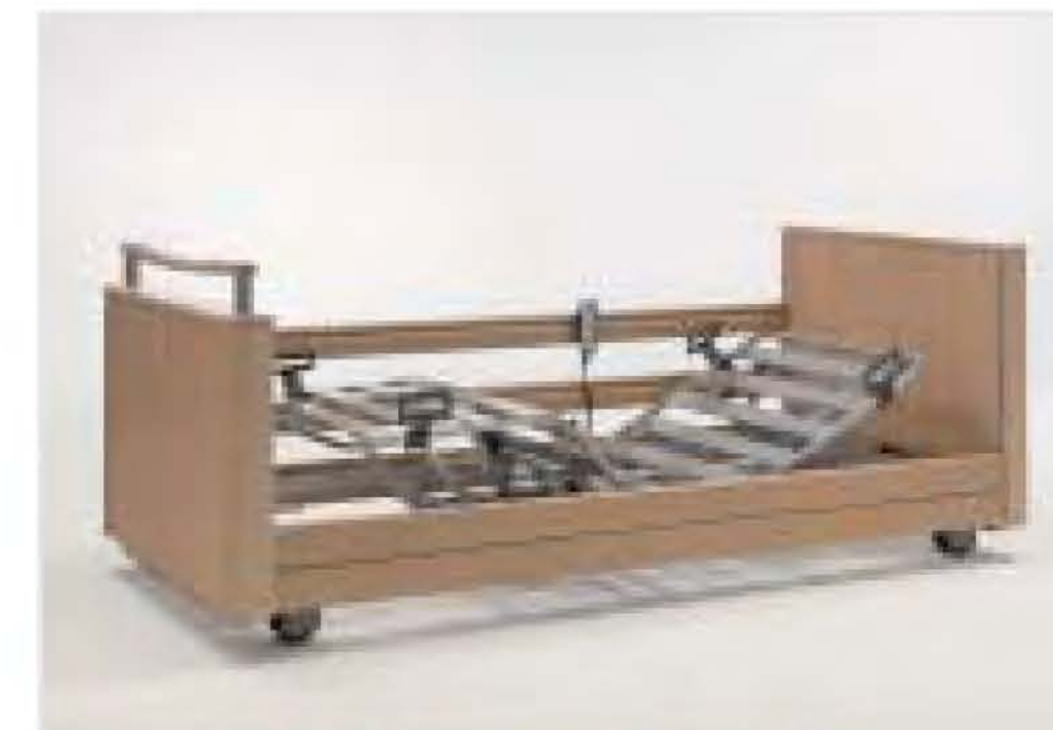
Unterschenkellehne manuell einstellbar

Einfach zu reinigende Liegeflächen-Lamellen