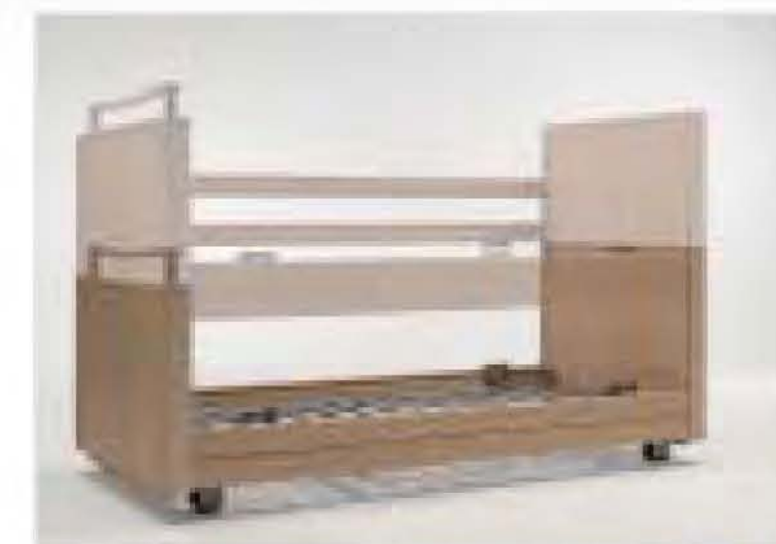
Liegehöhenverstellung von ca. 22 - 77 cm, Verstellbereich = 55 cm