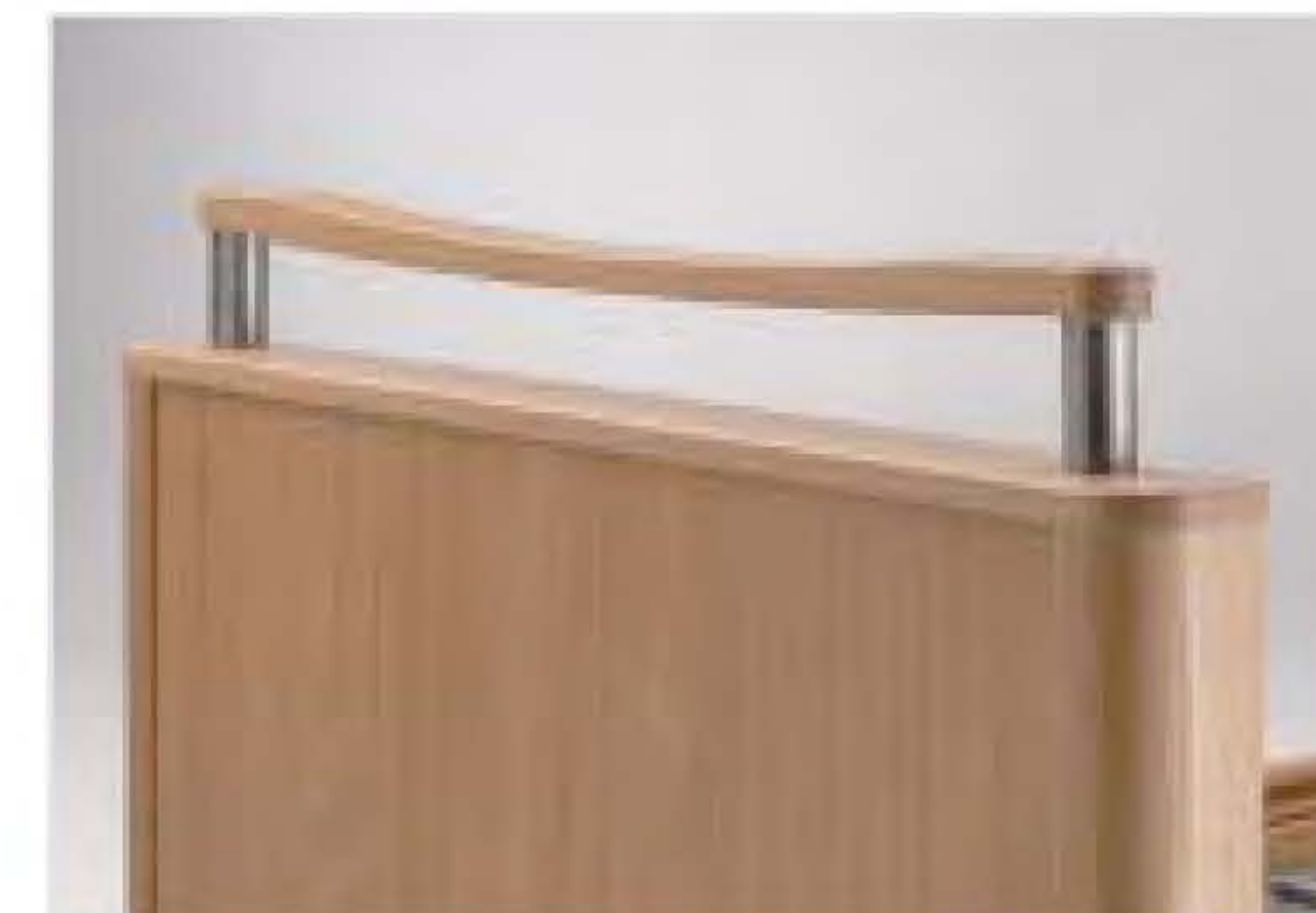
ergonomisch geformte Griffleiste