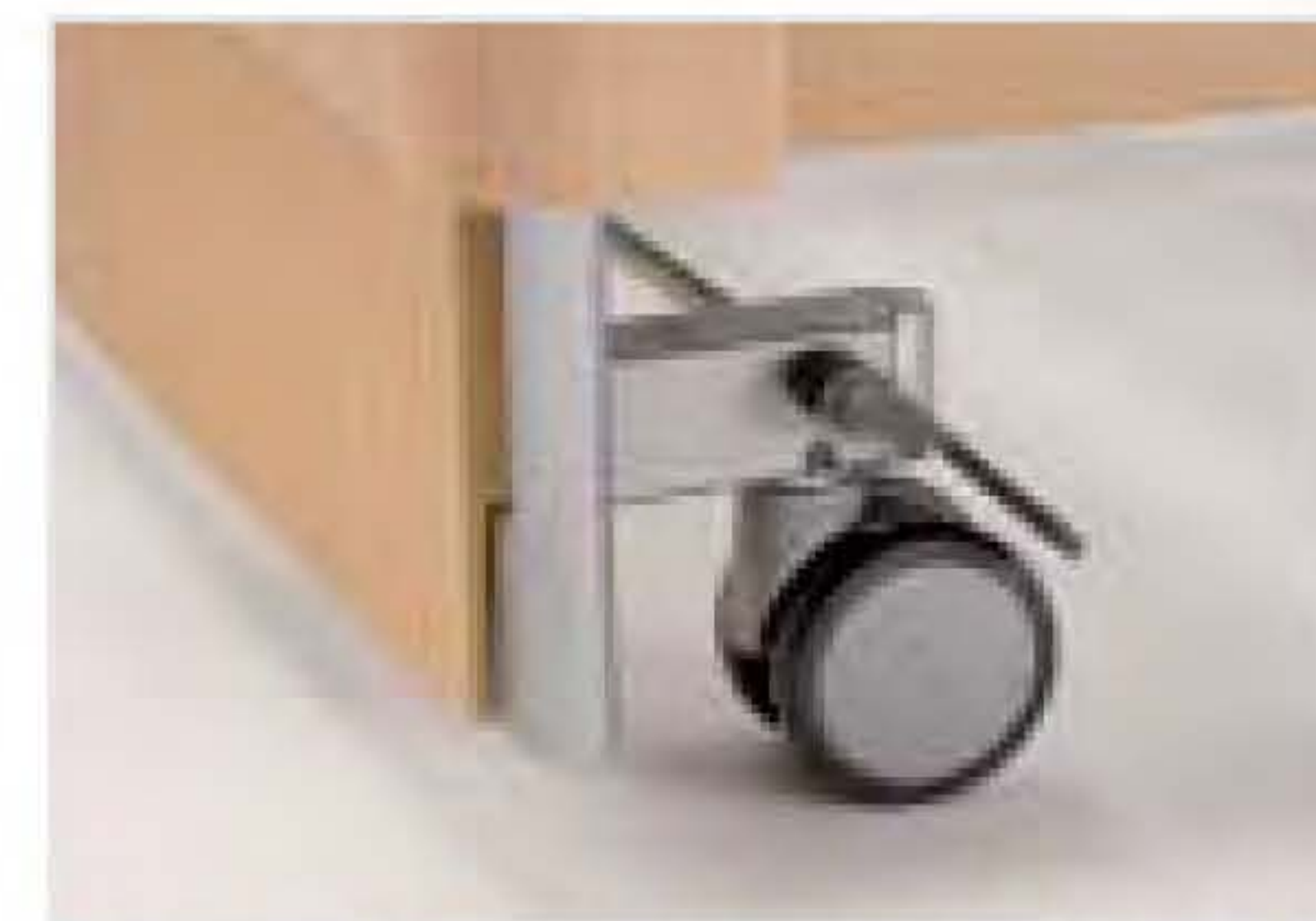
Paarweise Rollenfeststellung in jeder Liegeflächenposition

Trotz 55 cm Höhen-Verstellbereich niedrige Holzhaube im ansprechenden Wohndesign