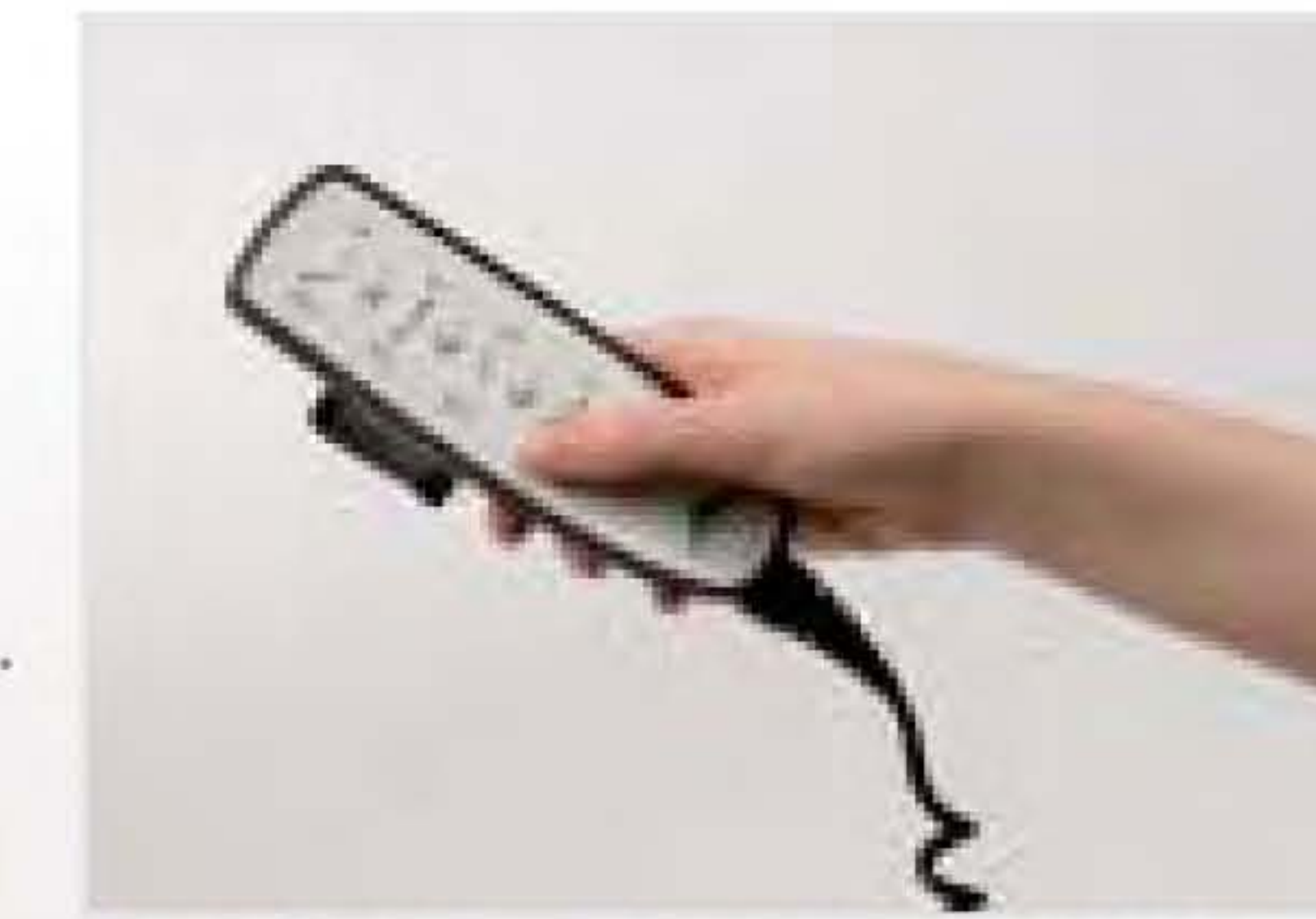
24 Volt-Antriebssystem mit selektiv-sperrbarem Handschalter

Seitengitter Schutzhöhe von ca. 45 cm für Matratzen bis max. 23 cm