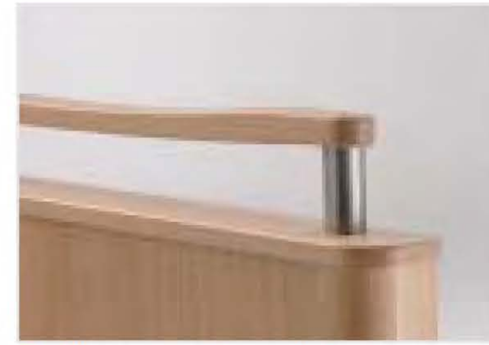
Griffleiste aus Massivholz

225 kg sichere Arbeitslast, 4-geteilte Liegefläche, elektrisch verstellbar